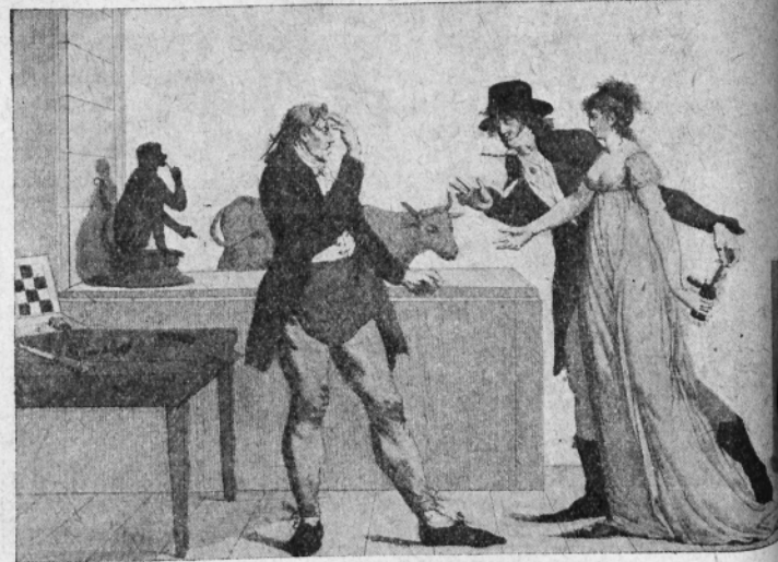
Fig. VII. — Admirable effet de la vaccine.