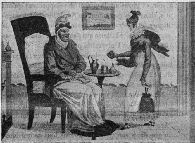
Fig. XI. — Mon oncle, je vous la souhaite bonne, accompagnée de plusieurs autres.

Il y a dissidence jusque dans le comité de la vaccine. Les médecins n'ont jamais témoigné d'urbanité entre confrères.