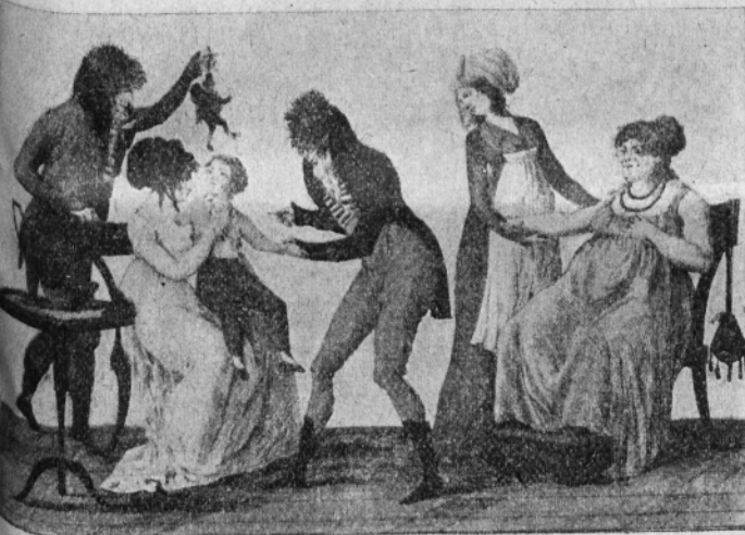
Fig. III. — La vaccination.