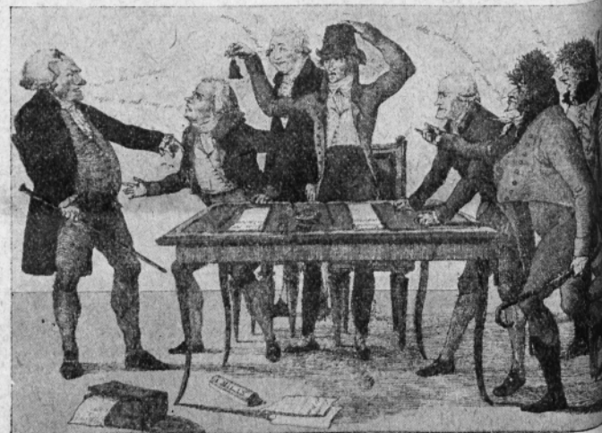
Fig. IX. — Sept contre un ou le comit  de la vaccine.