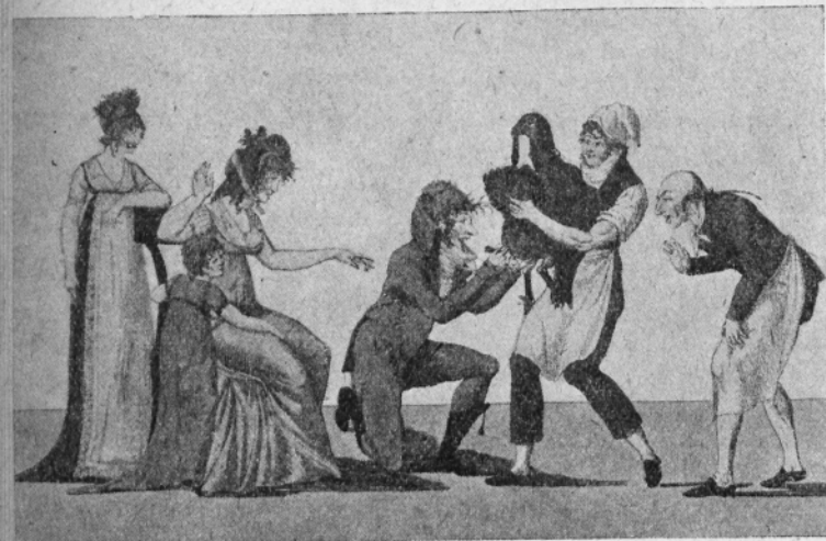
Fig. VI. — La dindonnade ou la rïvale de la vaccine.