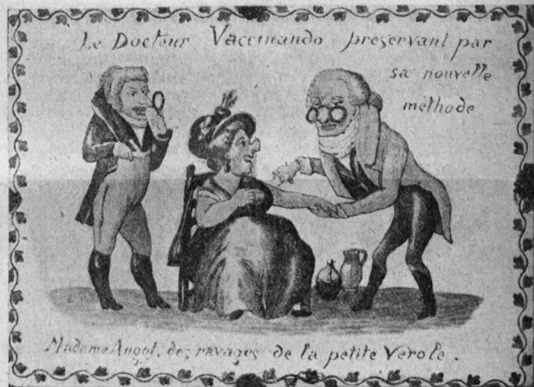
Fig. IV. — Madame Angot se fait vacciner.

elle inoculation Desertant un délice, la vaccination place grâce au caprice. gère ses succès, Hippocrate en murmure,