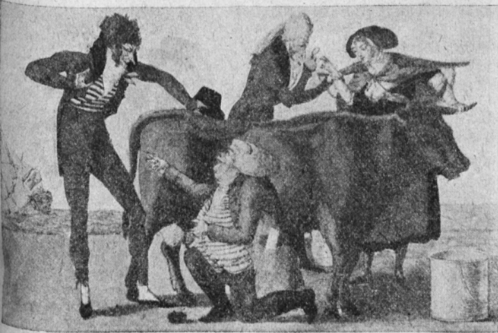
Fig. I. — L'origine de la vaccine.