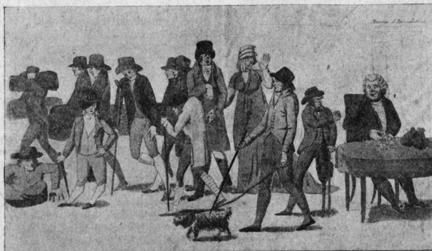
Fig. X. — Les bienfaits de la petite v role.