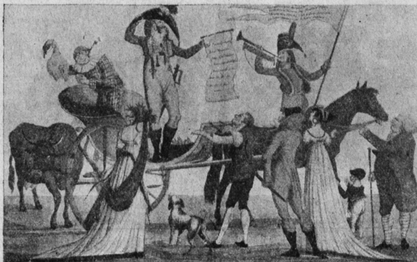
Fig. V. — La vaccine en voyage.

elle inoculation Desertant un délice, la vaccination place grâce au caprice. gère ses succès, Hippocrate en murmure,