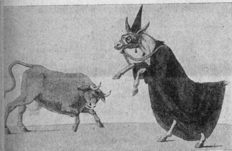
Fig. VIII. — La vaccine aux prises avec la Faculté.